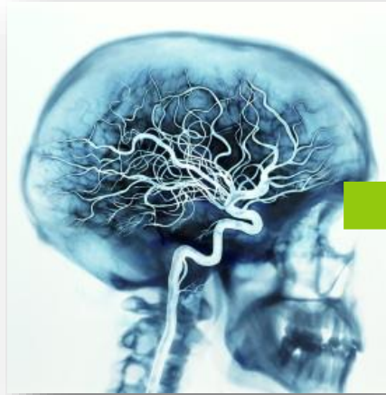
Sistema nervioso central